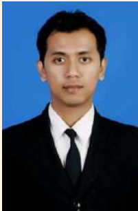
SEPTAVIRA TRI AGUNG

Ditetapkan di Jakarta, 14 Oktober 2023 Enacted in Jakarta, October 14, 2023